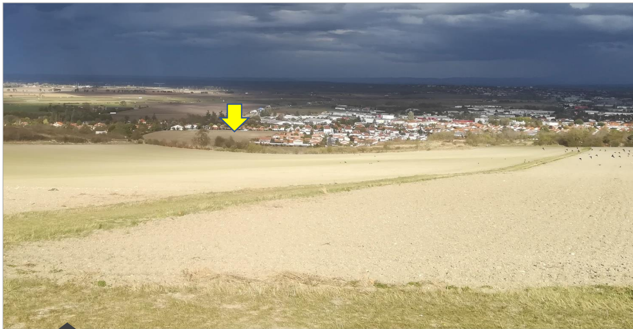
Vue depuis le puy Long